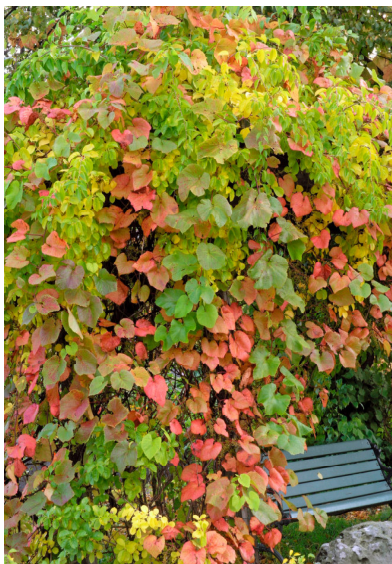
Rotblättriger Baumwürger ( Celastrus orbiculatus )