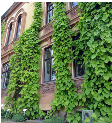
Pfeifenwinde ( Aristolochia macrophylla )